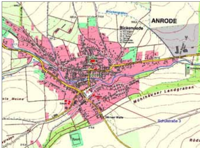
Ausschnitt Übersichtskarte Bickenriede © Gemeinde Anrode