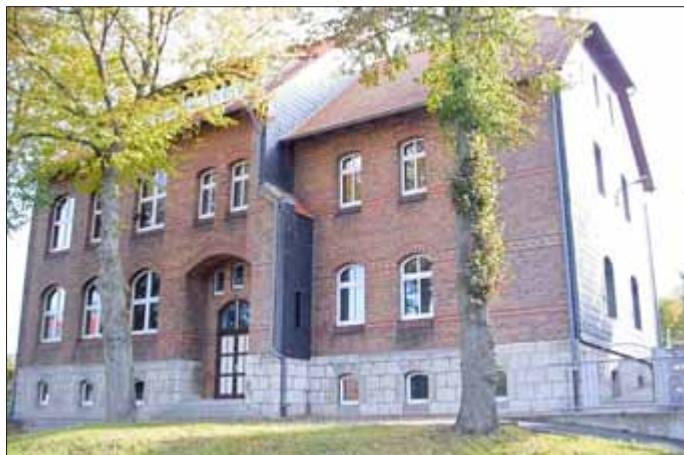
Straßenansicht, Haupteingang ehemaliges Schulgebäude