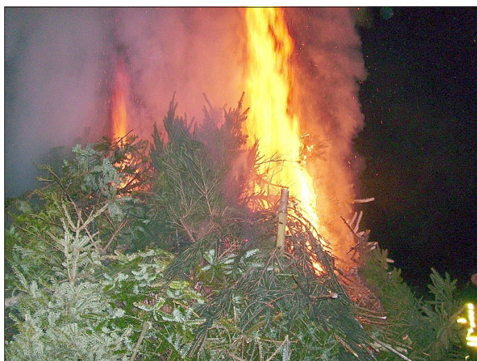
Das Einsammeln der Weihnachtsbäume erfolgt am 25. Januar ab 8.00 Uhr.

Wenn das Christkind nicht mehr zittert, keiner mehr Geschenke wittert, wenn die Kerzen schon erkalten, muss auch der Baum nicht länger halten. Stellt man ihn vors Haus geschwind, kommt die Jugendfeuerwehr schnell wie der Wind, schleppt ihn flugs zum Brennplatz schnell, wo am 08. Februar ab 16.00 Uhr ein Feuer brennt so hell.