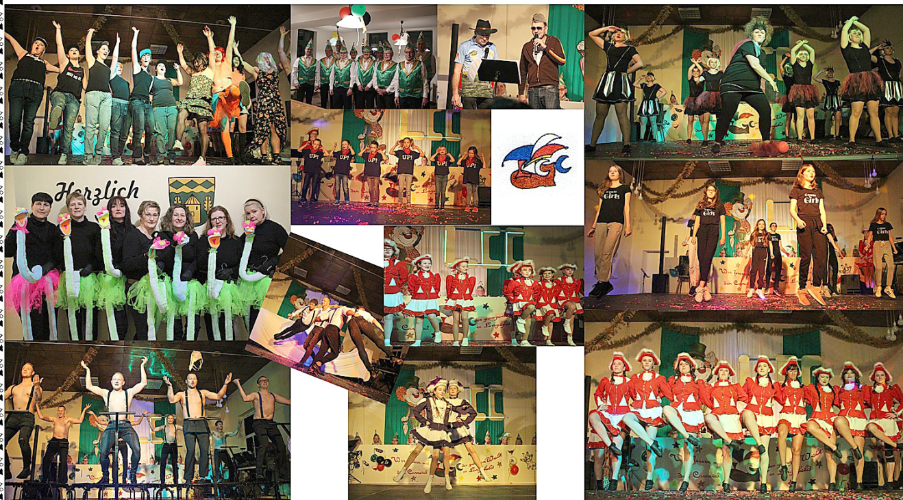
Lengelfelder Carnevals Club