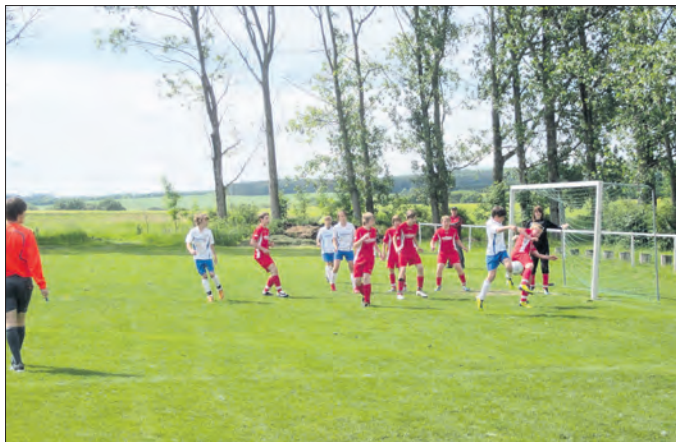
Mit sehenswerten Toren erkämpften sich unsere D-Junioren einen stolzen 3. Platz im Kreispokalfinale.