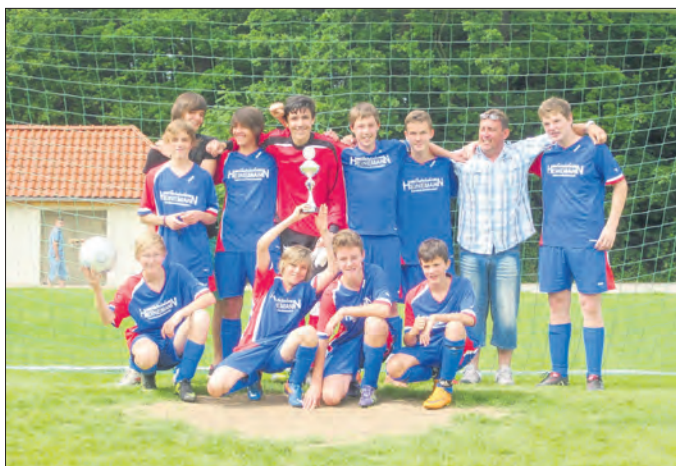
Die C-Junioren der Spielgemeinschaft Horsmar/Bickenriede setzten auf den Kreismeistertitel noch den Kreispokalsieger obendrauf - Glückwunsch an die Jungs!