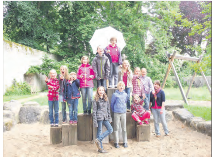
Kindergruppe der evangelischen Kirchengemeinde Lengefeld