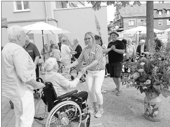
Ein Tänzchen ...

Wir danken an dieser Stelle allen Kollegen der „Heiligen Louise“ für die hervorragende Teamarbeit, die zum Gelingen des Festes beigetragen hat.