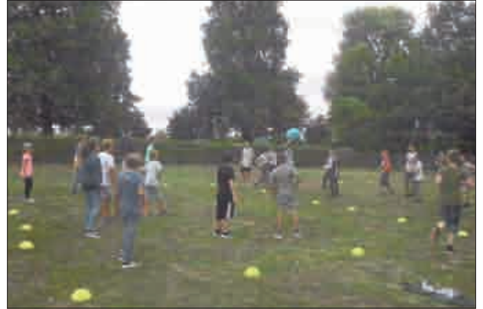
Den meisten Spaß machte das Zweifelderballspiel