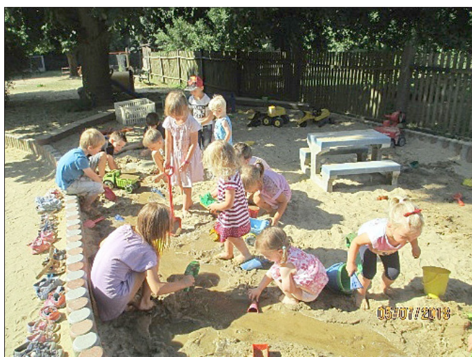
... viele Badetage und Matschen im Sand