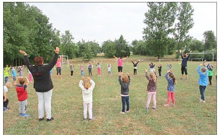
... ein Sportfest auf dem Sportplatz von Lengefeld