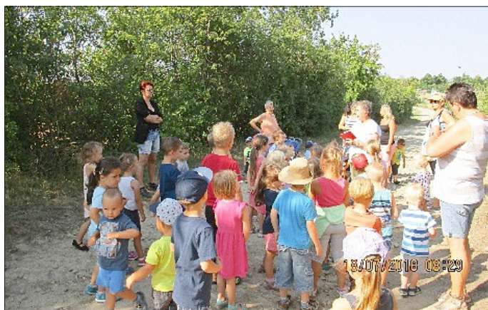
... Wandertag mit Aufgaben und Rätseln dem Weg