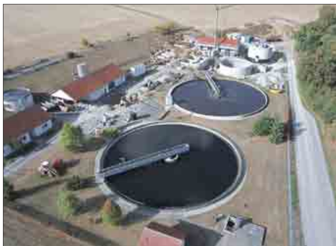
Erweitert und energetisch optimiert wird bei laufendem Betrieb die Kläranlage Horsmar – Vorbild hierfür ist ihre große Schwester im Leinetal.

Bei Abwasserlösungen in kleinerem Rahmen setzt die EW-Tochter auf die intelligente Verbindung naturnaher und technischer Lösungsansätze. Hier erfolgt die Abwasserreinigung als Kombination von Scheibentauchkörpern und Schönungsteichen/Biofiltern. Diese vollbiologischen Anlagen fügen sich gut ins Landschaftsbild und zeichnen sich durch eine hohe Betriebssicherheit aus. Gleichzeitig arbeiten sie mit einem Energiebedarf von jährlich rund 15 – 25 kWh pro Einwohnerwert sehr energiesparend. Ein Beweis: vergleichbar große Anlagen herkömmlicher Technologien, wie dem Belebtschlammverfahren, liegen bei jährlich bis zu 100 kWh pro Einwohnerwert.