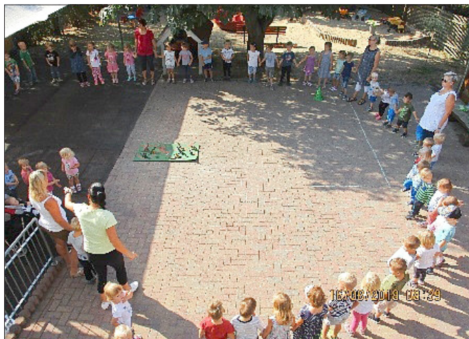
... Dinoparty mit vielen Spielstationen, Ausgrabungen und einem echten Vulkanausbruch