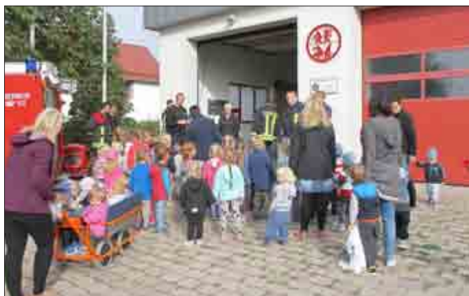
... Feuerwehrfest bei der Feuerwehr in Lenefeld in Lenefeld