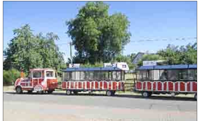
... eine Fahrt mit der Tschu-Tschu-Bahn durch die Gemeinde Anrode