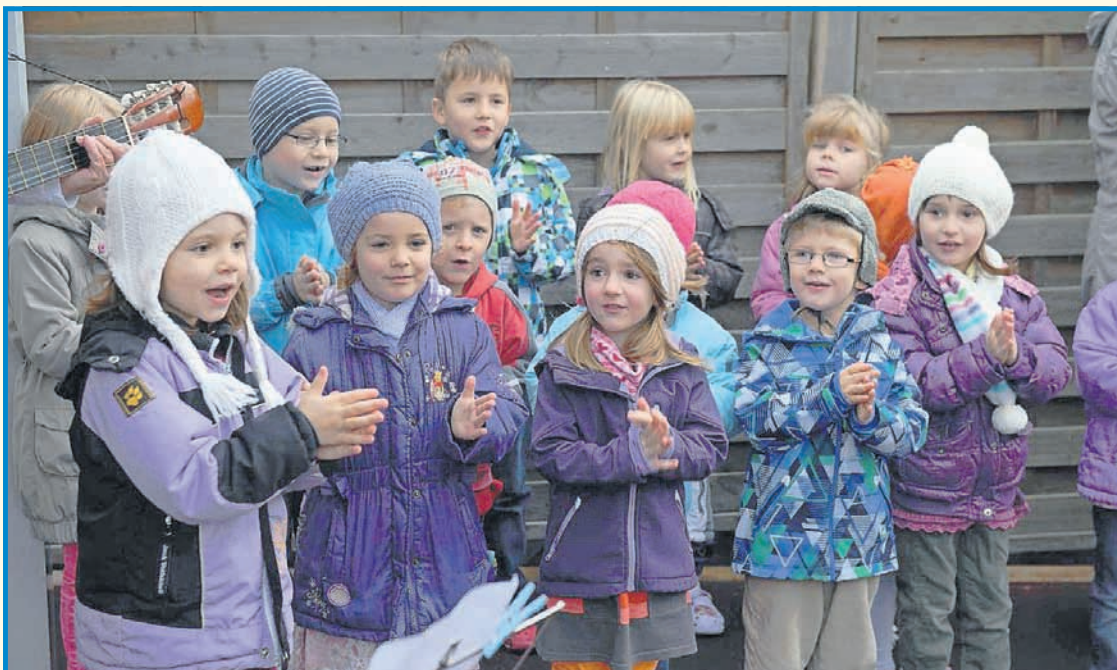
Kinder der Bärengruppe

Danach gingen die Großeltern mit ihren Enkeln in die Gruppen und verbrachten einen gemütlichen Nachmittag.